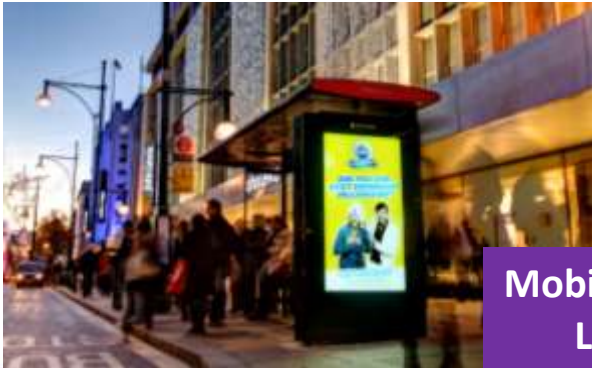
Mobilier Urbain Londres