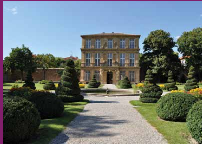
PAVILLON VENDÔME 13 RUE DE LA MOLLE, 13100 AIX-EN-PROVENCE